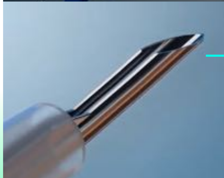
Aguja de bajo perfil