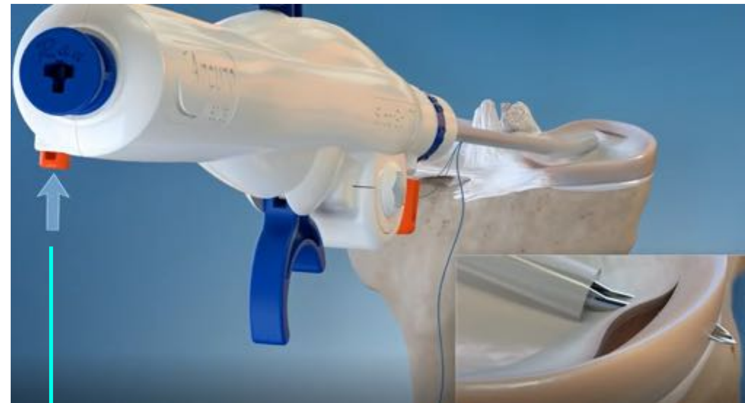
Botón de seguridad